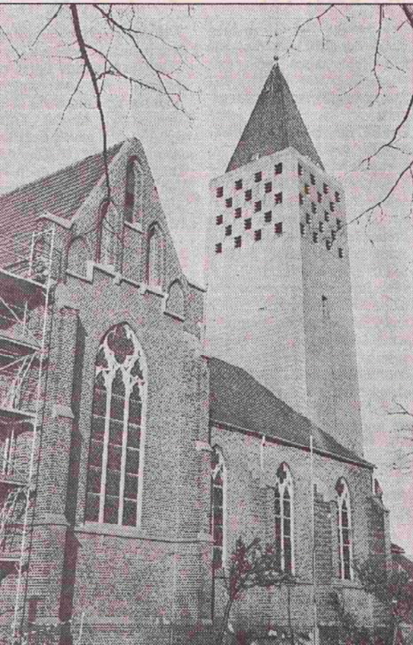
Die Fenster der katholischen Kirchengemeinde St. Nikolaus in Kempen müssen repariert werden. Doch nicht der preiswerteste Anbieter bekommt den Zuschlag.